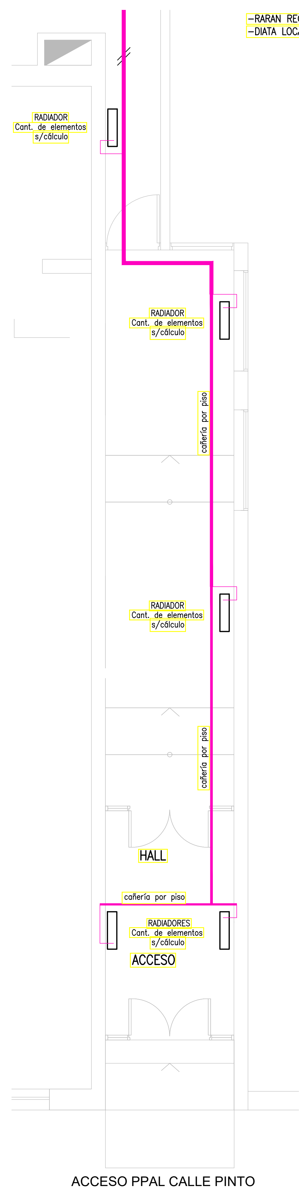
ACCESO PPAL CALLE PINTO