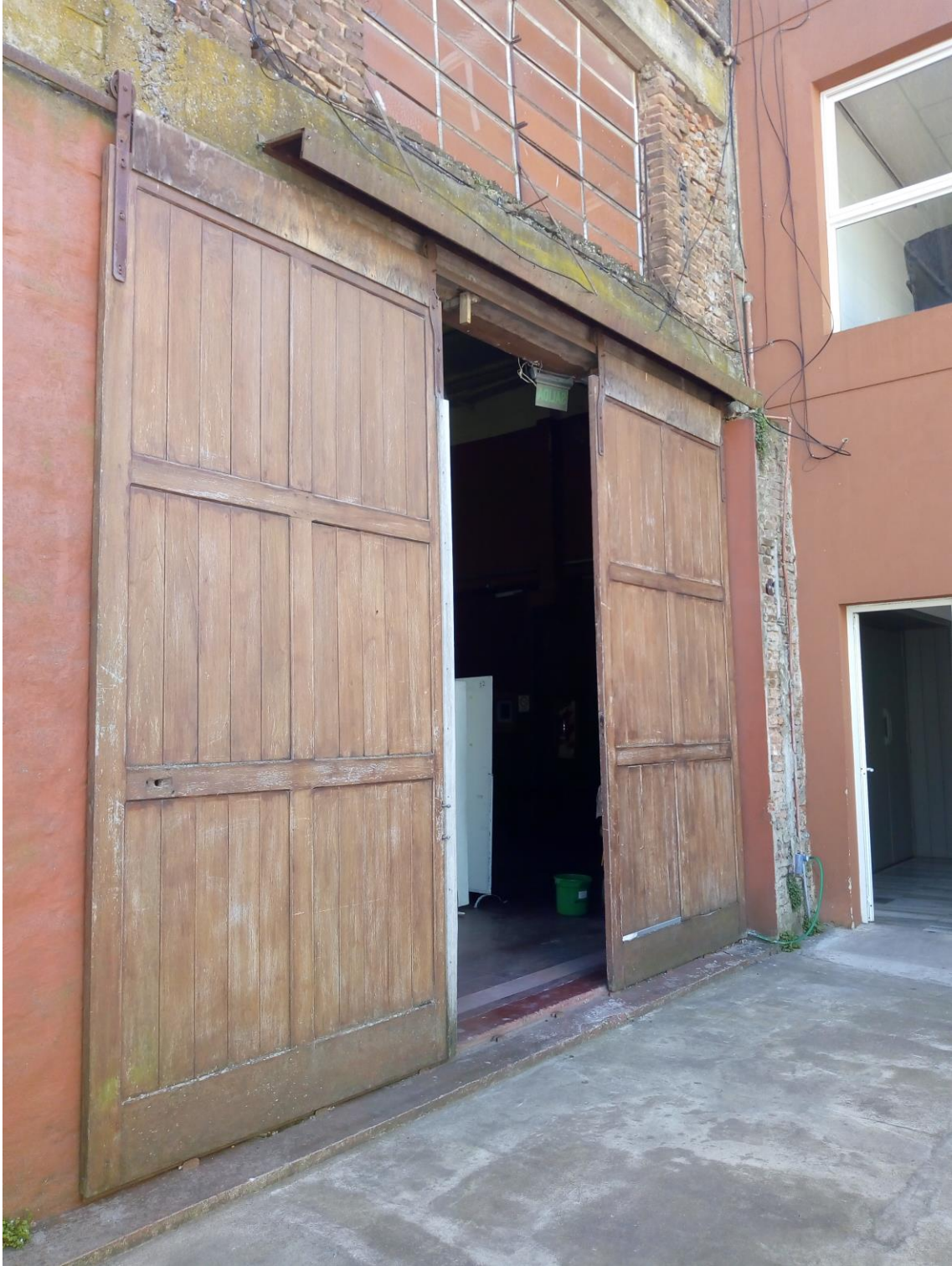
Puerta de acceso gimnasio a reemplazar