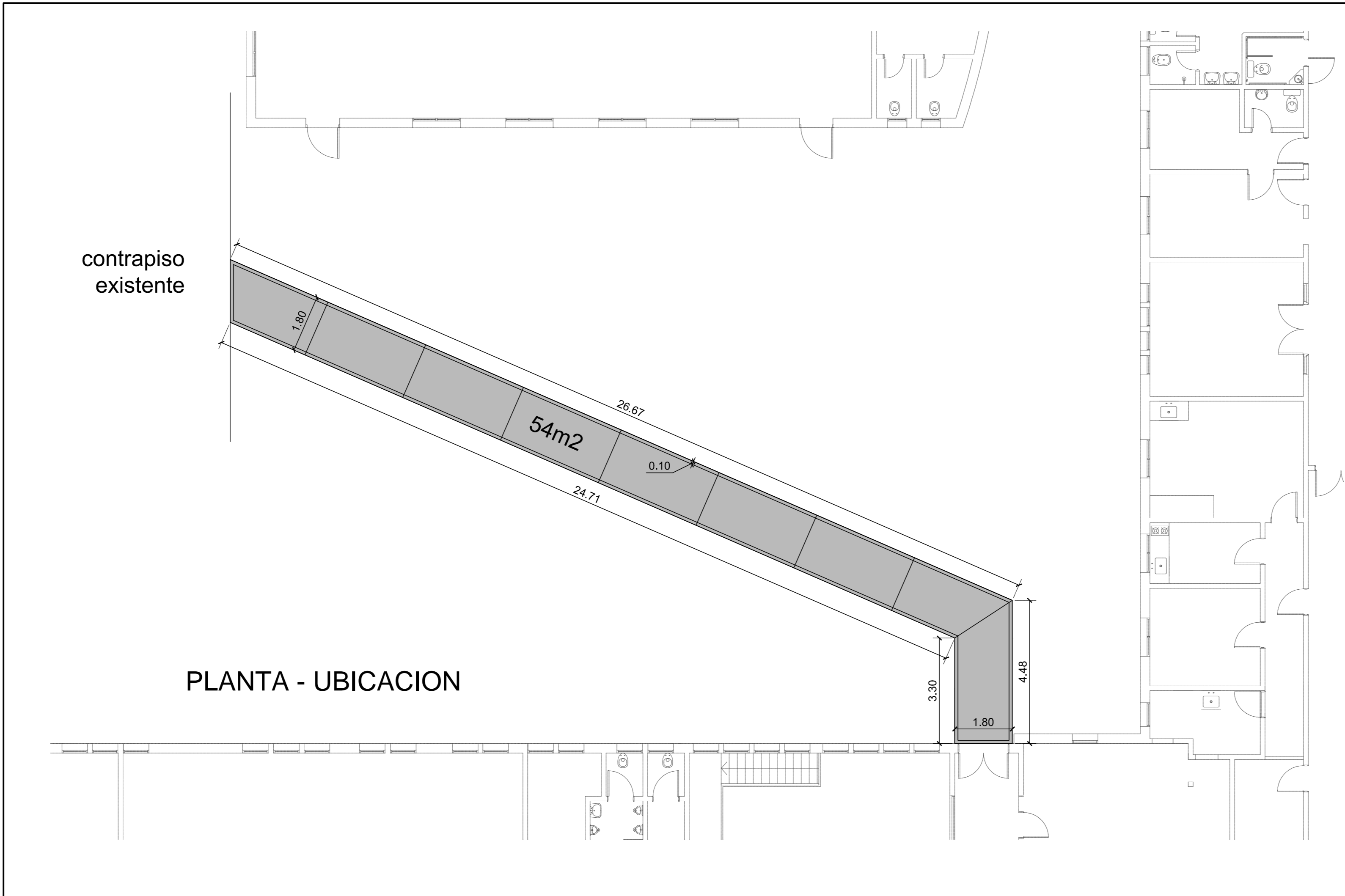
PLANTA - UBICACION