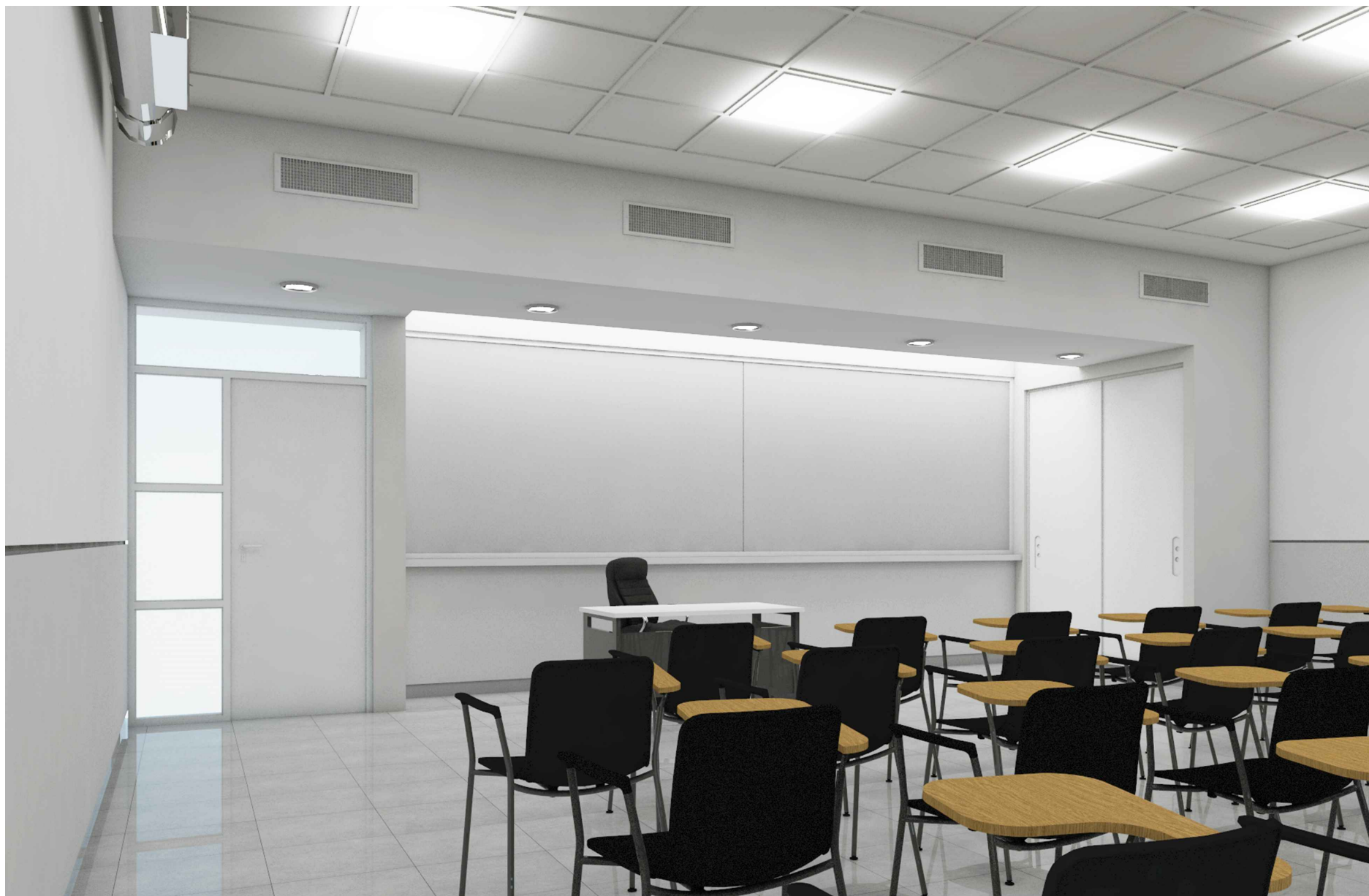
PERSPECTIVA FRENTE AULA